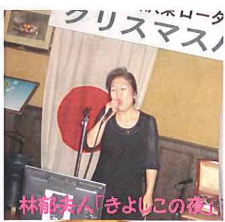
林郁夫人「きよしの夜」