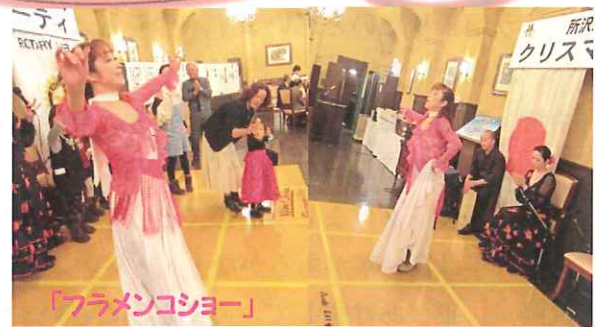
「フラメンコショー」