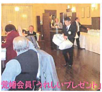
荒幡会員「うれしいプレゼント」