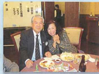
会長・幹事夫妻・「とっておき no スマイル」