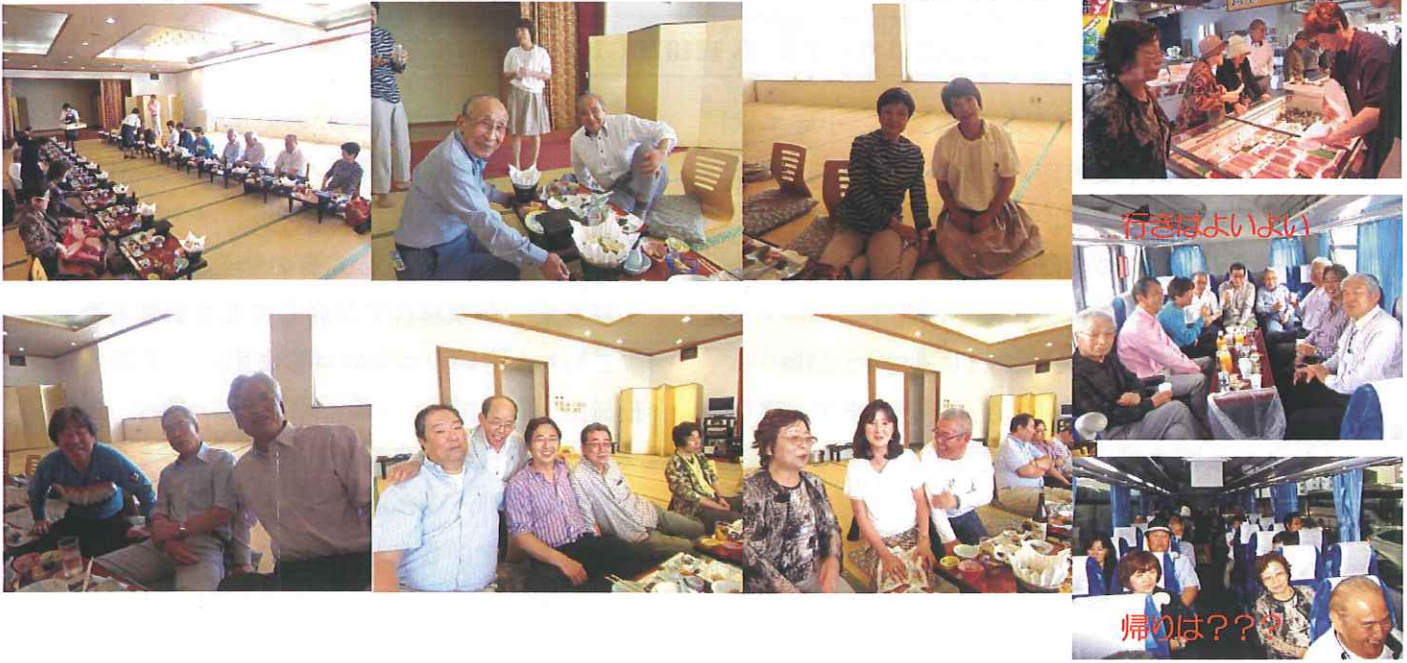
☑ 三崎港 (買い物)