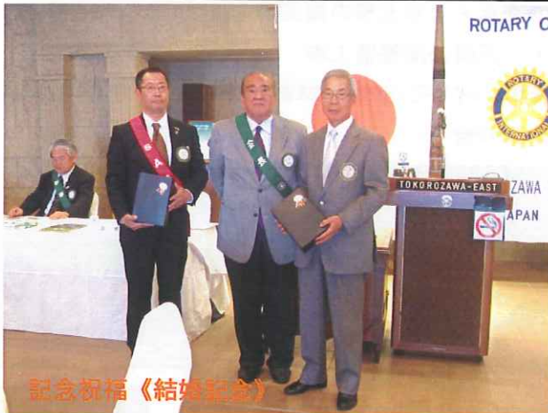
記念祝福《結婚記念》