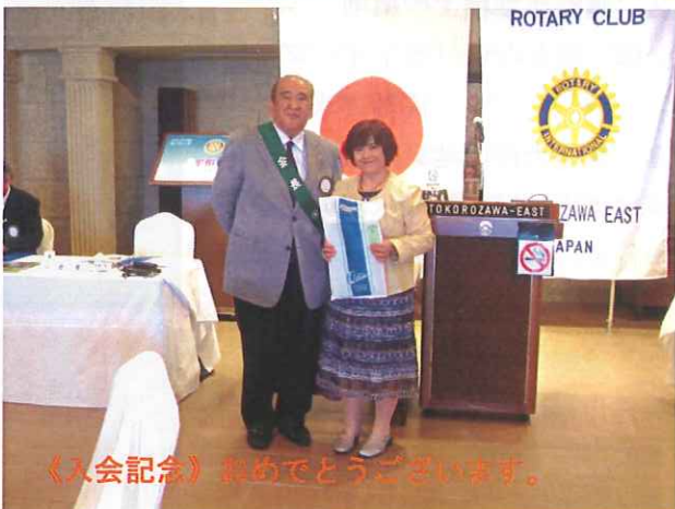
《入会記念》おめでとうございます。