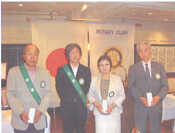
記念祝福《入会記念》の皆様