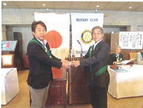
記念祝福《結婚記念・入会記念》おめでとうございます。