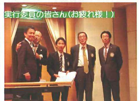
実行委員の皆さん(お疲れ様!)