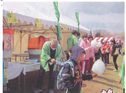
「コラボ」のあったかい春が所沢っ子(中学生)、東っ子とともにやってきた!