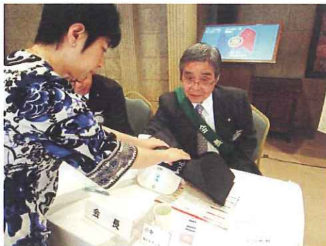
小寺会長・・・測定値は?