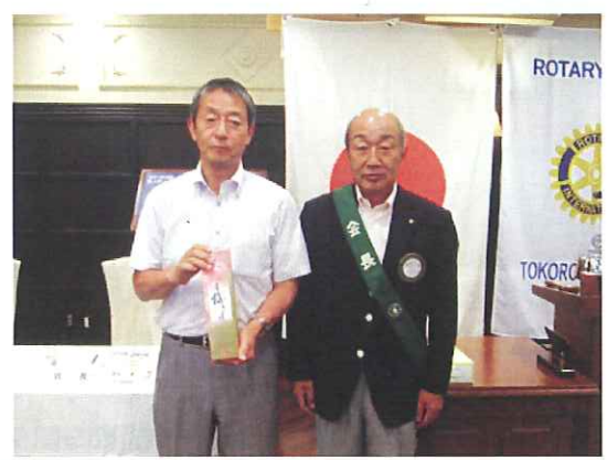
記念祝福《結婚記念》おめでとうございます。

しみにしております。私も現在、地元北秋津・上安松の土地区画準備組合の会長をしているので、緑地問題等で今後お世話になりますがその節は宜しくお願いたします。これからの社会は、少子化・環境問題が大変重要視されてまいります。私たちも真剣にこの問題について学び、暮らしやすい社会になるよう努力していきたいと思っております。並木様、卓話宜しくお願いたします。