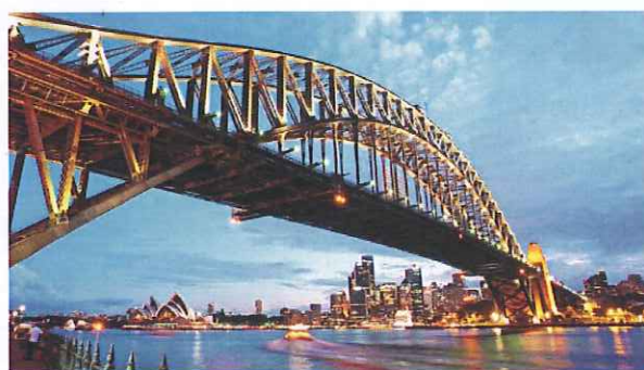
世界からシドニーへ「ロータリー国際大会」(HP)