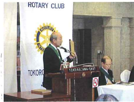
朝木様より「徳蔵寺の歴史」贈呈本の紹介

歴史のお好きな方にはとても興味のあるお話かと思えます。又、先程2冊の本を贈呈いただきましたのでぜひ会員の皆様に読んでいただきたいと思います。