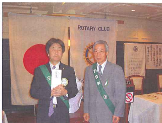
記念祝福《会員誕生》