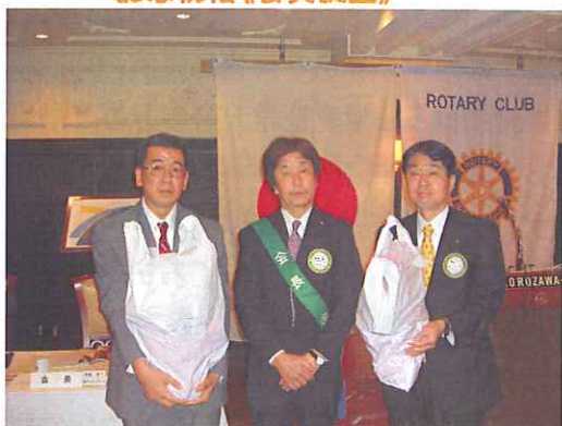
記念祝福《ご夫人誕生》