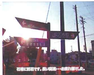
早々と石巻到着、被害の状況を目の当り