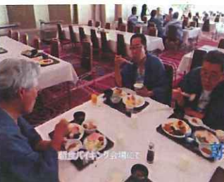
道徳的・社会的に