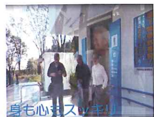
身も心もスッキリ!