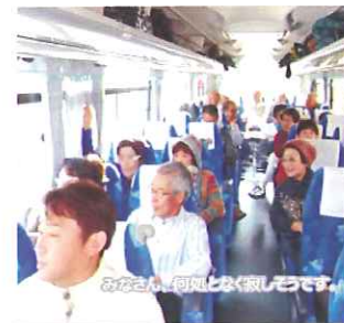
名残惜しくも宿をあとにして