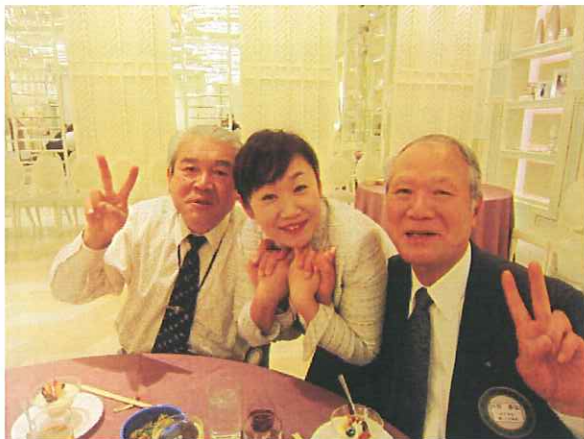
「幸せオーういっぱい！」飯田・日野会員