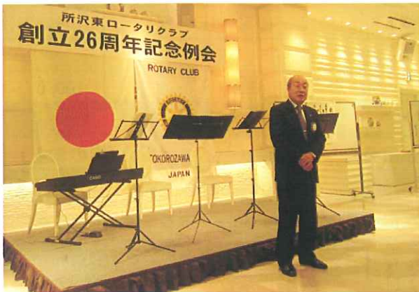
懇親会 挨拶 肥沼会長