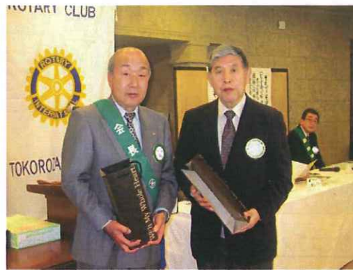
《記念祝福・結婚記念》おめでとうございます。

刃物の生産が盛んな地域と記されておりました。本日の卓話で堺市をピーアールしていただきたいと存じます。射手矢様どうぞ宜しくお願いいたします。