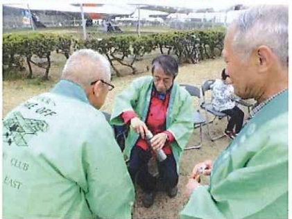
アツカカ差し入れ〇〇心地 後方支援で頑張る皆さん