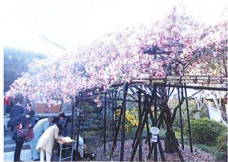
めぐり、めぐりて鎌倉大仏さまと笑顔の締め括り