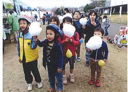
わたがし大好きポーズ