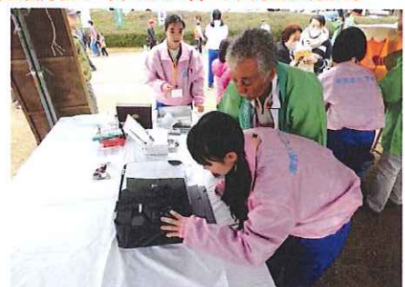
写真の出来上がりはバッチリ! 「お疲れ様」の記念撮影