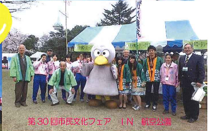
第30回市民文化フェア IN 航空公園