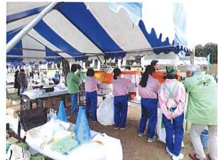
今年もGO! ボランティア中学生勢揃い