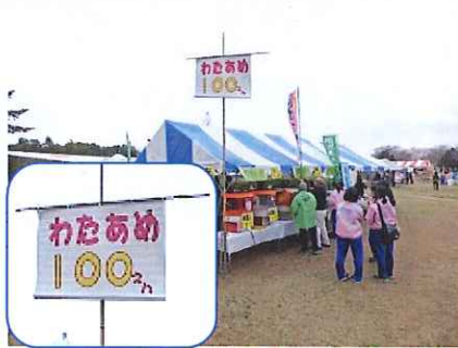
「わたあめ」旗&4台フル稼働準備万端!