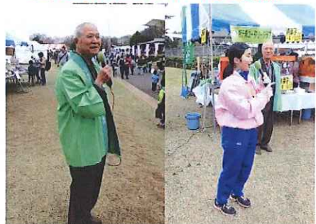
日野宣伝隊長も 爽やか!「美・マイク」にほれほれ