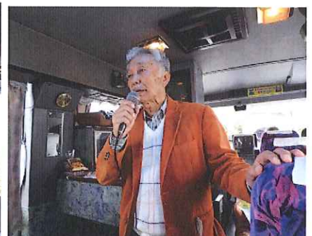
いざ、出発！老若男女問わず、道中の楽しさここにあり