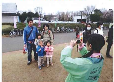
「親子でチーズ」 今年の目玉「ロータリーデー」親子写真プレゼント