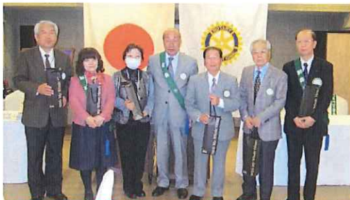
記念写真《結婚・入会記念》の皆様