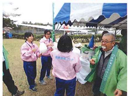
パバリ!! お「あ・じ・み」