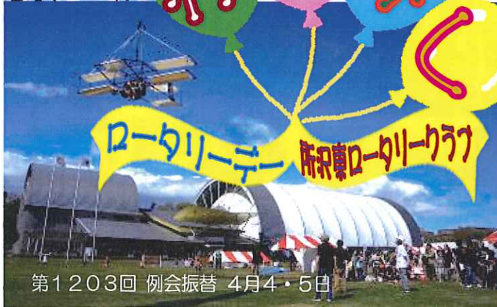
第1203回 例会振替 4月4・5日