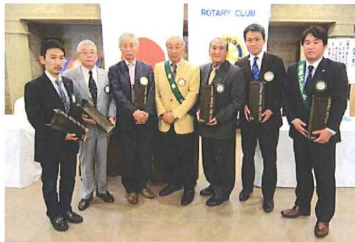
記念祝福《結婚・入会記念》の皆様