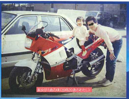
長女が1歳の頃(当時20歳のわたし)