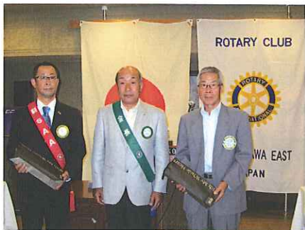
《結婚記念》 《入会記念》 の皆様