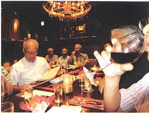
「飲んで!」「飲んで!」・・・「飲まれないヨ!」