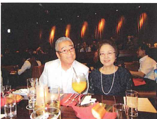
今宵もラブ・ラブだ!