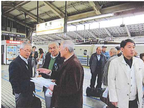
東京駅から新幹線で京都に向かいます