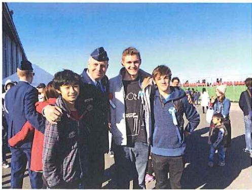
入間航空ショー (マックス君と)