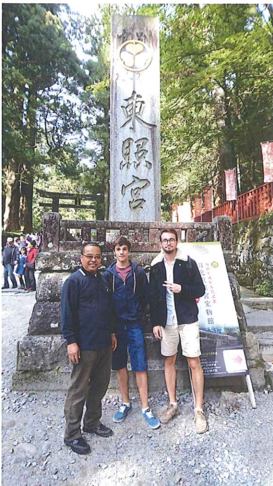
日光東照宮へ (フランスからの同級生と)