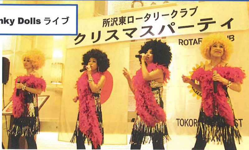
Tokyo Funky Dolls ライブ