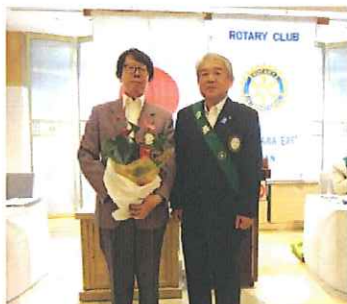
《ご夫人誕生記念祝福》

皆様こんにちは。毎日猛暑で、まだ身体が慣れない中、大変だと思いますが、お体にお気をつけて頂きたいと思います。