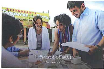
世界を変える行動人

My ROTARYは、ロータリー会員の皆様のために提供されています。 ロータリー会員の皆様は、My ROTARYのホームページをご覧ください。