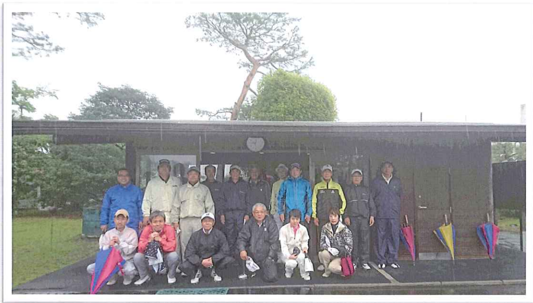
飯田年度第2回ゴルフコンペ開催 日高カントリークラブ 4月25日(水)