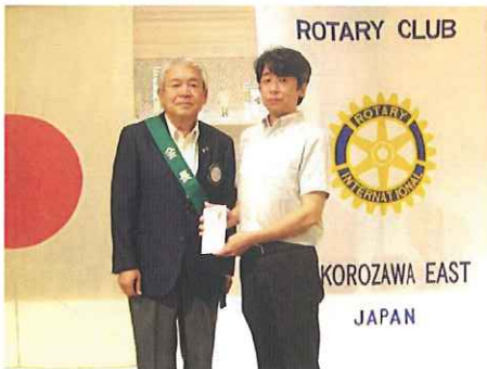
《社会福祉法人皆成会様》