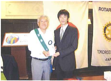
《認定NPO法人JHP学校をつくる会様》