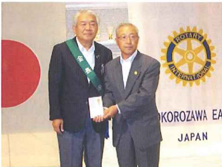
《所沢市社会福祉協議会様》