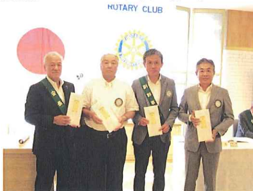
《会員誕生記念祝福》

皆さま、こんにちは。先週木曜日は今年度初めての親睦行事で、軽井沢でのカーリング体験とバーベ