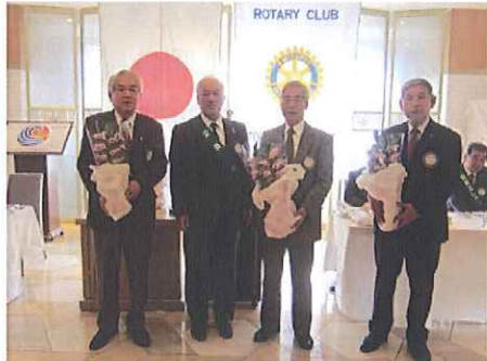
《ご夫人・ご主人誕生祝福》

皆さん、こんにちは。久しぶりのベルヴィでの例会になります。クリスマス例会では80名と大勢のご参加ありがとうございました。新年会も含めて親睦委員会の皆さまの企画など、本当にありがとうございます。