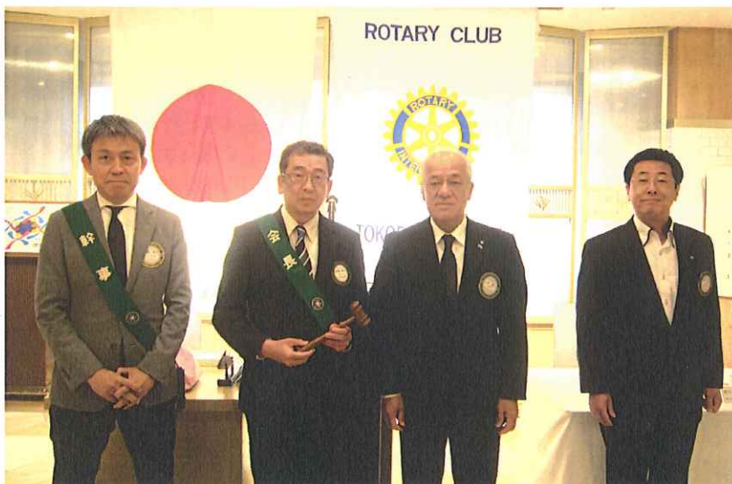
上田直前会長、長内前幹事、お疲れ様でした！