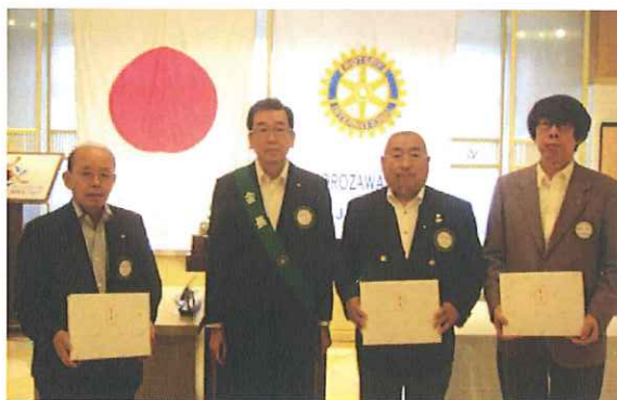
《ご夫人・ご主人誕生祝福》