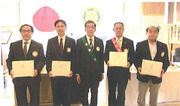
《ご夫人・ご主人誕生祝福》