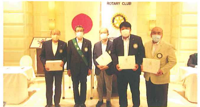
《ご夫人・ご主人誕生記念祝福》