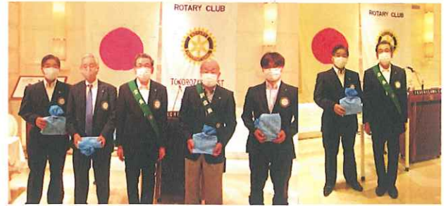
《会員誕生記念祝福》