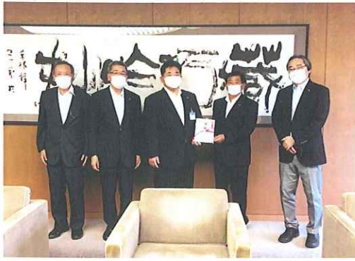
23日市長訪問・目録贈呈

そして、ハワイで行われる予定であった国際大会も中止となってしまいました。バーチャルで大会が開催されることになりました。