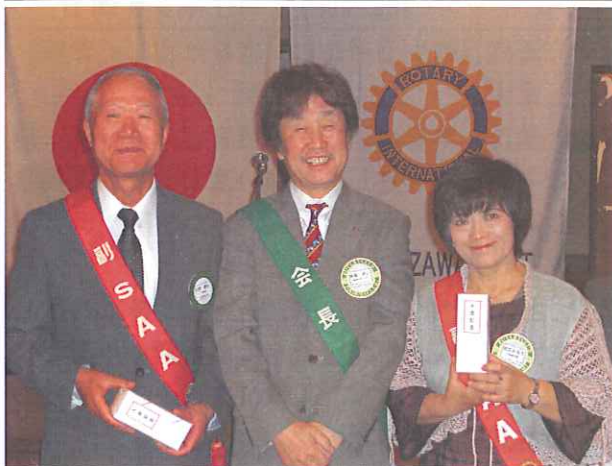
記念祝福《入会記念》おめでとうございます。