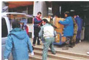
災害救援ネットワークより掲載

被災地のお寺の住職さんと連絡を取りながら活動しています。岩手県陸前高田の避難所で、