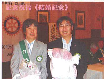
記念祝福《結婚記念》