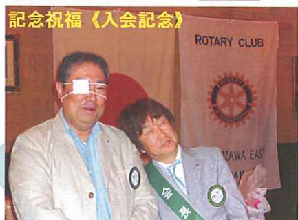
記念祝福《入会記念》