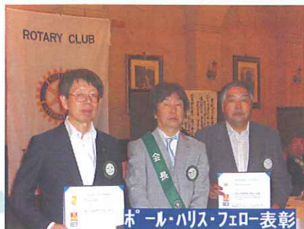
ホール・ハリス・フェロー表彰