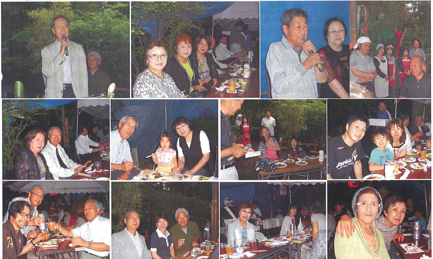
四つのテスト 1 真実かどうか 2 みんなに公平か 3 好意と友情を深めるか 4 みんなのためになるか どうか