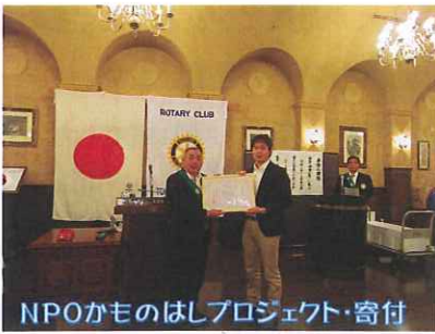
NPOかものはしプロジェクト・寄付