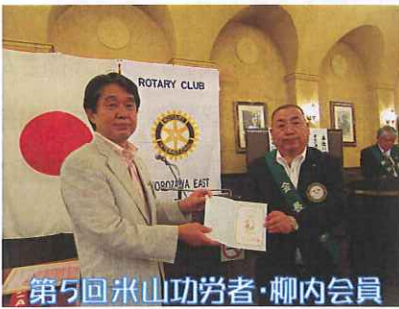
第5回米山功労者・柳内会員