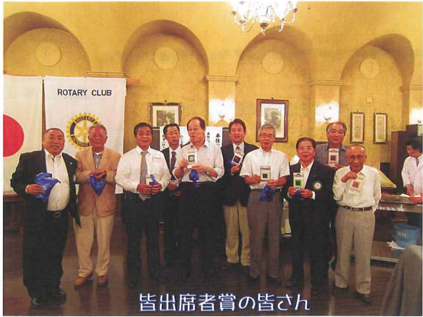
皆出席者賞の皆さん