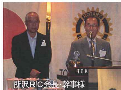
所沢RC会長・幹事様