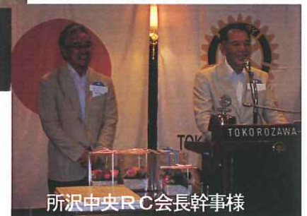
所沢中央RC会長幹事様