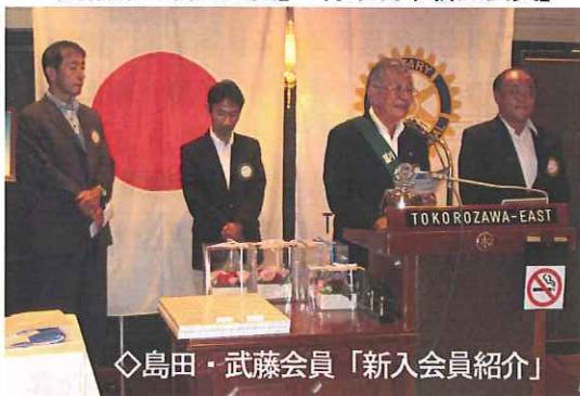
◇島田・武藤会員「新入会員紹介」