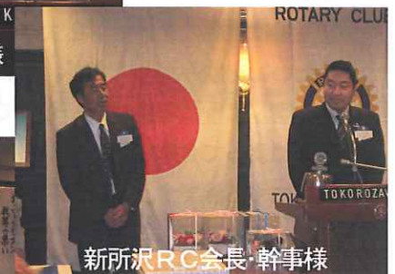
新所沢RC会長・幹事様