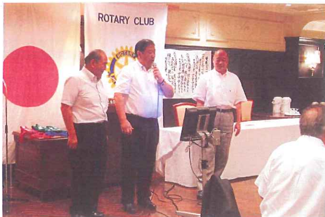
〇〇〇ノオ? ?...「はやみ歌健康法」