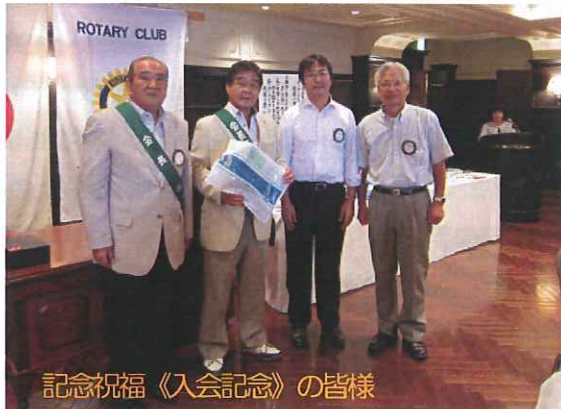
記念祝福《入会記念》の皆様