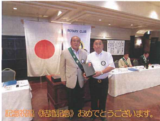
記念祝福《結婚記念》おめでとうございます。