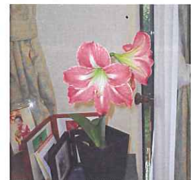
(当クラブのホームページでも綺麗な画像でご覧頂けます)