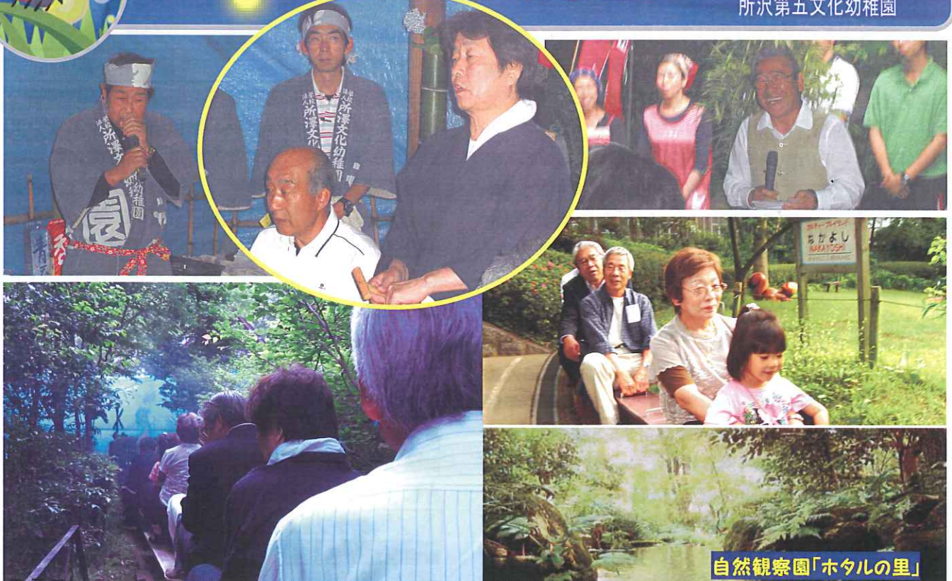
自然観察園「ホタルの里」

四つのテスト 1 真実かどうか 2 みんなに公平か 3 好意と友情を深めるか 4 みんなのためになるか どうか